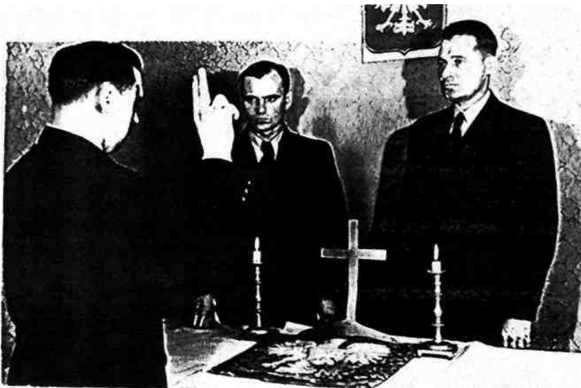
Składanie przysięgi przez wstępującego do ZWZ